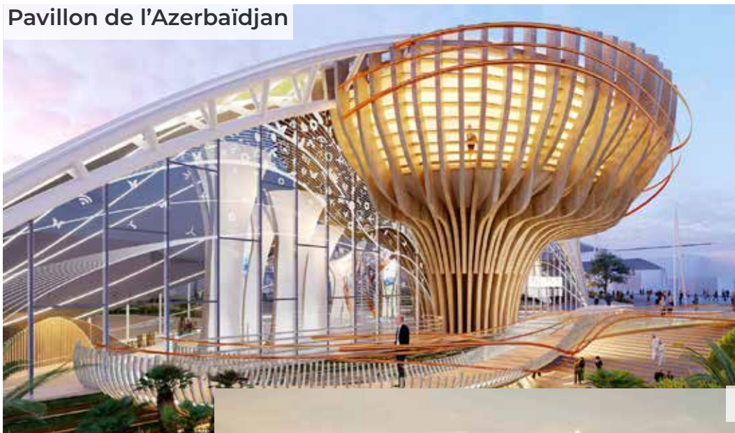
Pavillon de l'Azerbaïdjan