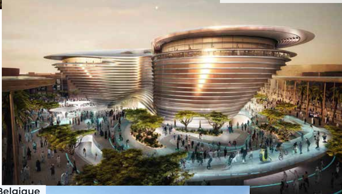
Pavillon de la Belgique