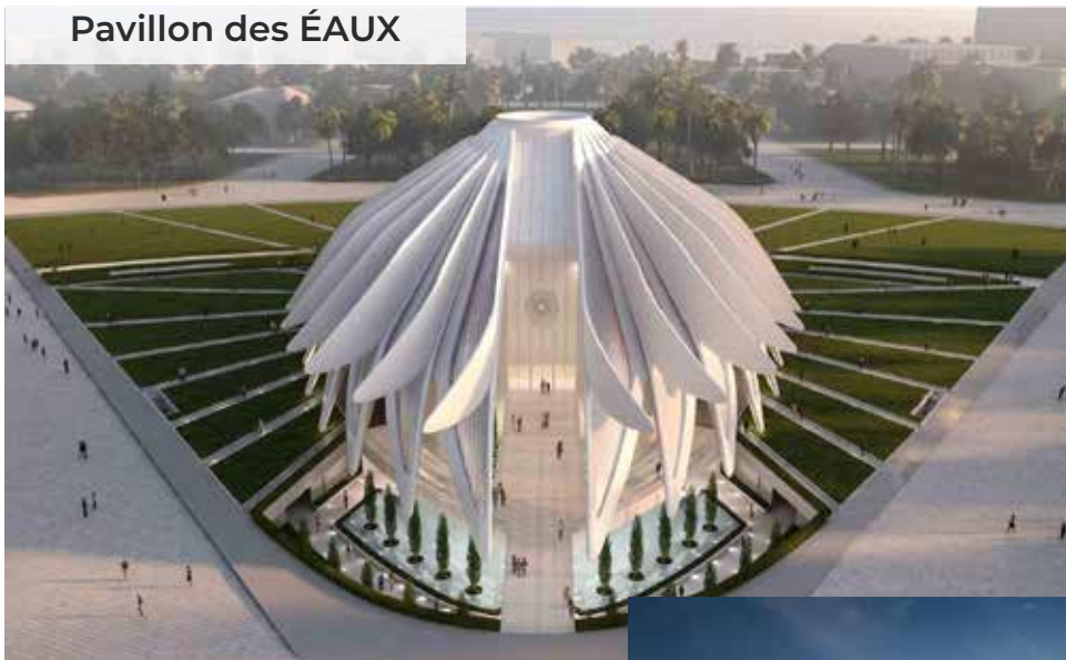
Pavillon des ÉAUX